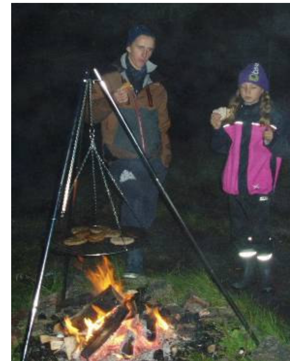
Mat på bål.

Allerede kvelden før dro 13 speidere til Guldstølen for å overnatte i gapahuk. Til tross for mange dager med dårlig vær og ikke noe bedre værmelding, fikk speiderne en flott kveld og natt i gapahukene, uten de store nedbørsmengdene.